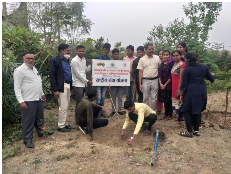
Plantation near Crematory place at Karhe village