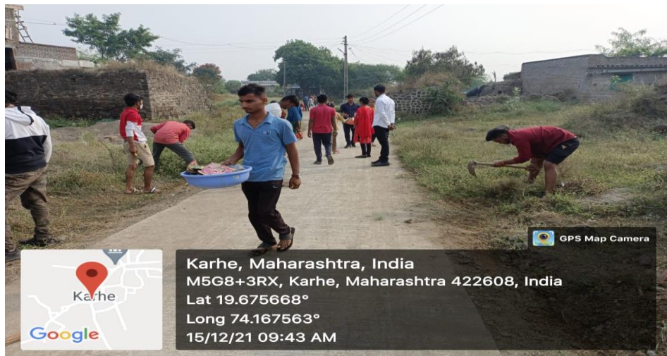
Karhe Village Middle Road cleaning