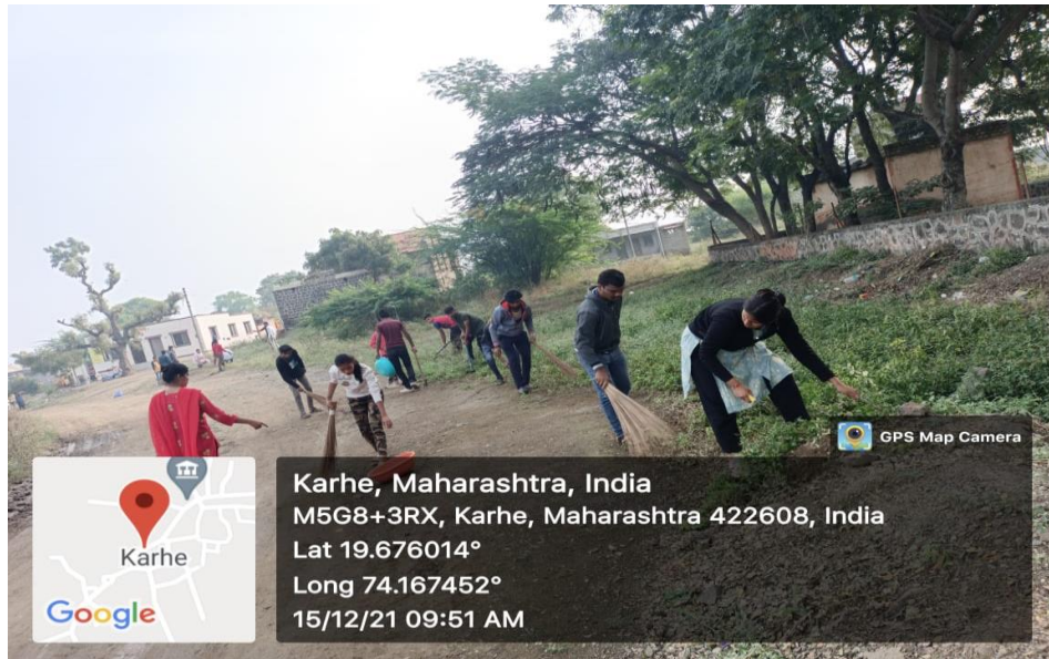
Karhe Village Cleaning