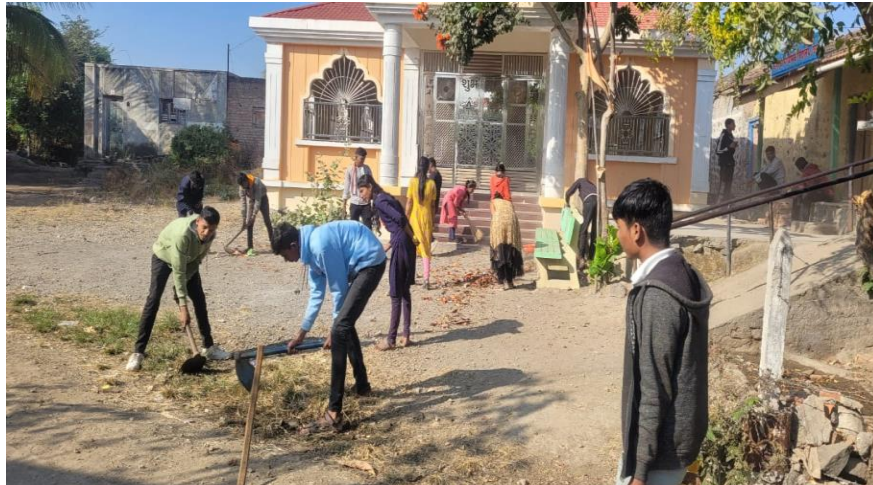
Karhe Village Temple Area Cleaning

Cleanliness is the act of keeping yourself and your surroundings clean. Keeping clean will help you keep yourself and everyone around you healthy.