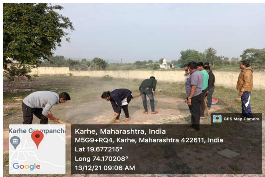
Karhe Village Road Cleaning Program