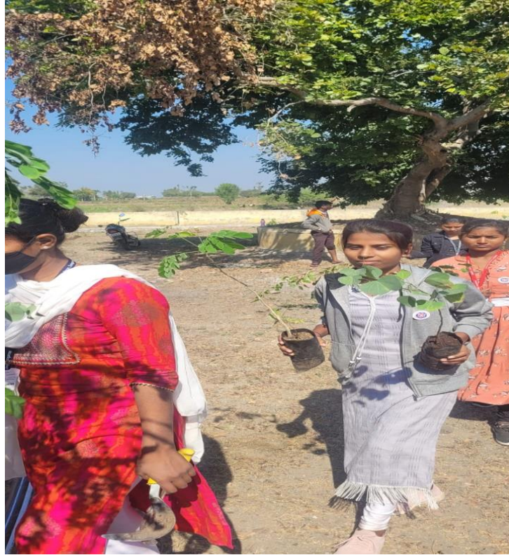
Plantation near School area at Karhe Village.

Life is better with trees. It has been demonstrated that spending time in green areas and around trees helps us feel less stressed during the day. So we plant plants. In this program total of 300 plants of different species were planted in 3 different places