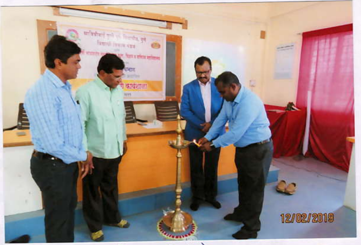
लेशोधन पध्दती कार्यशाळेचे उद्घाटन करताना मान्यवर