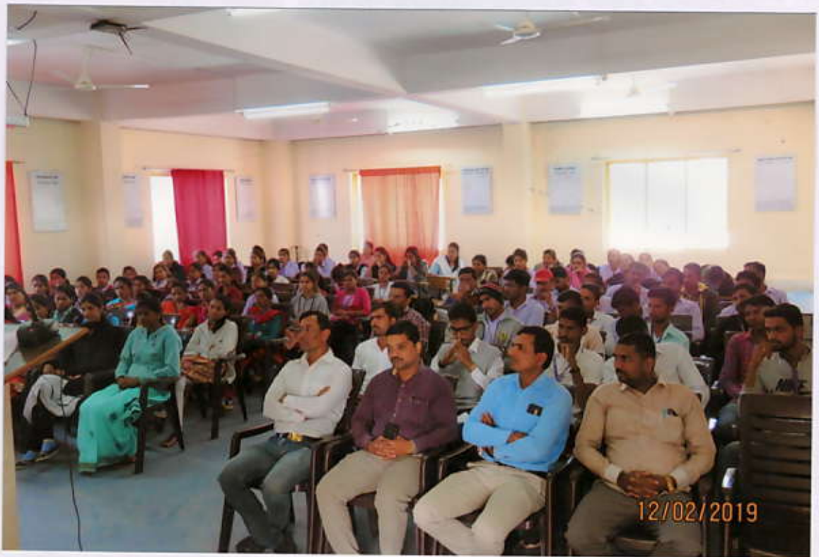
अंशोधन पध्दती कार्यशाळेत उपस्थित विद्यार्थी व प्राध्यापक