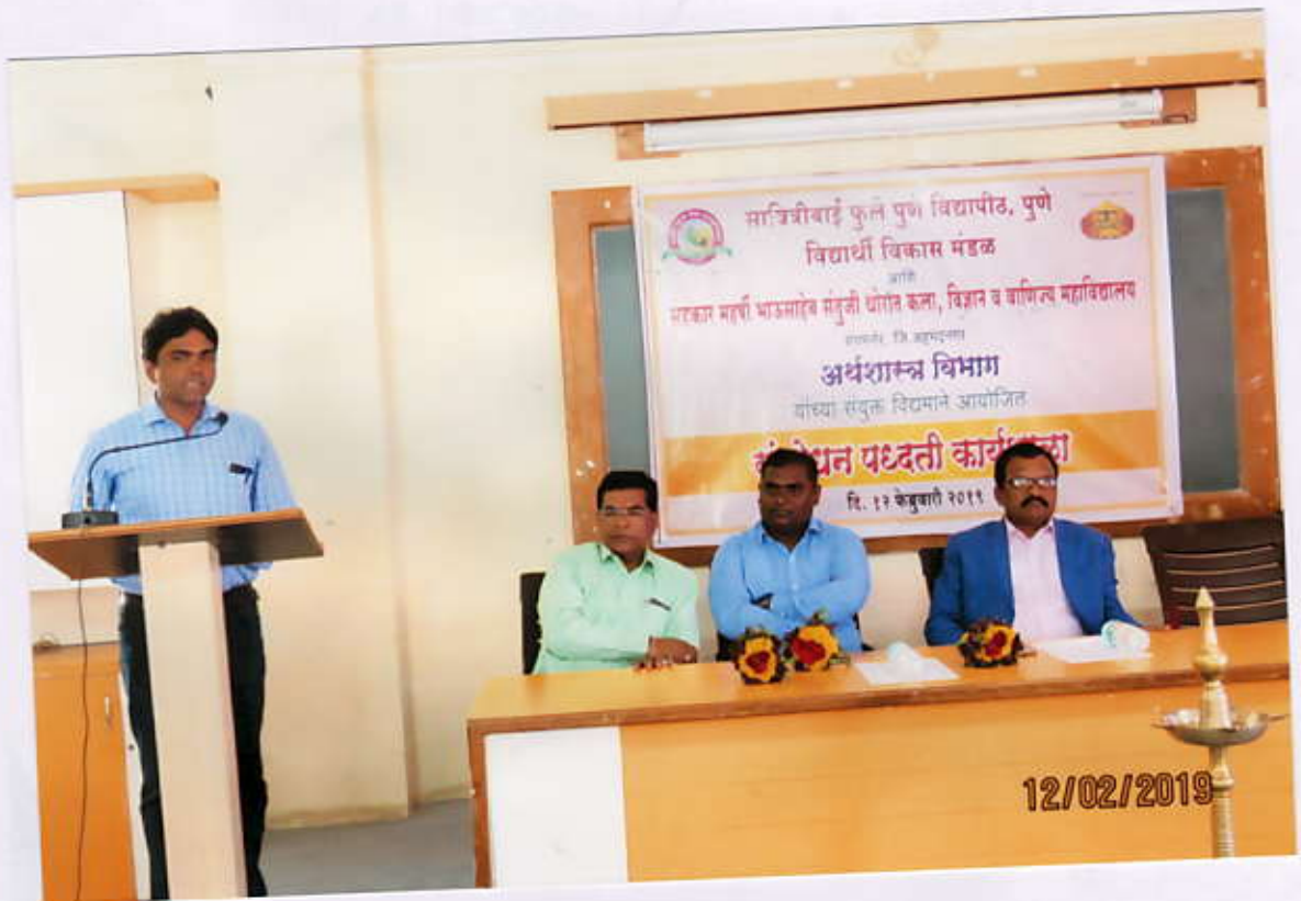
संशोधन पध्दती कार्यशाळेकेंत मार्गदर्शन करताना

प्राचार्य स.म.भा.सं.धोरत महाविद्यालय संगमनेर