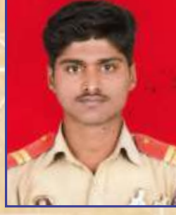
घुले गोकुळ मारुती अंडर ऑफिसर (आर.डी. कॅम्प)